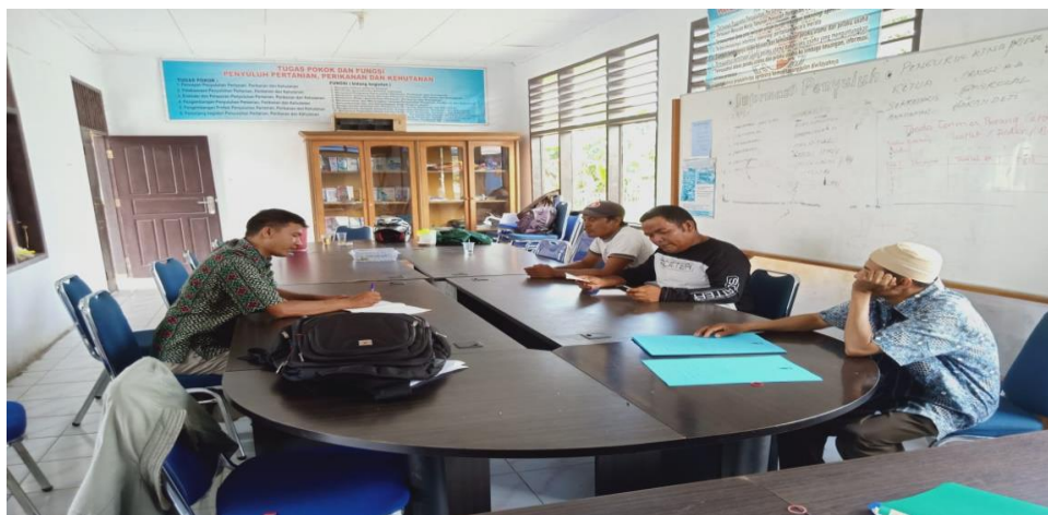
Berdiskusi tentang Rencana Kegiatan Kelompok