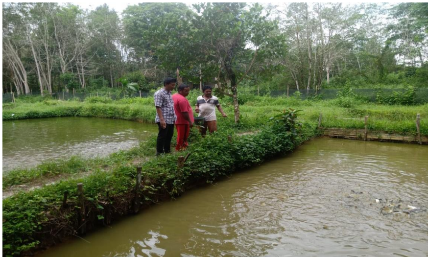
Lokasi Kolam Kelompok