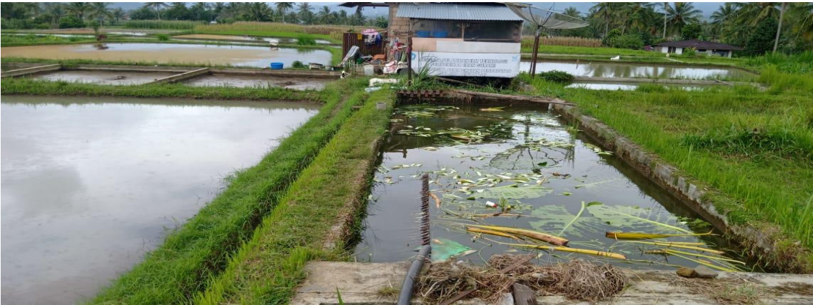
Lokasi Kolam Kelompok