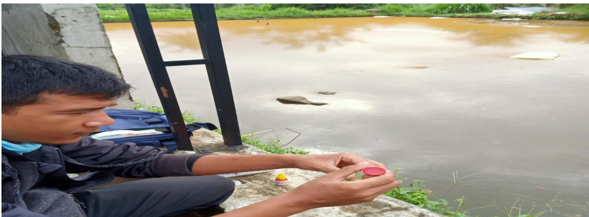
Pengujian Kualitas I air kolam ikan Kelompok