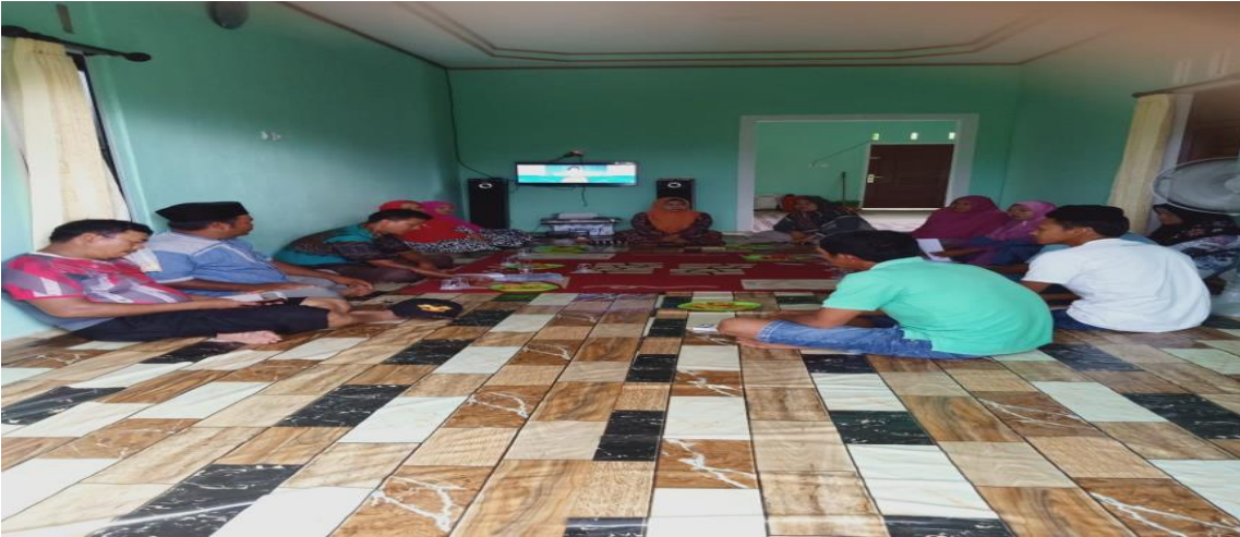
Pertemuan Pembentukan Kelompok