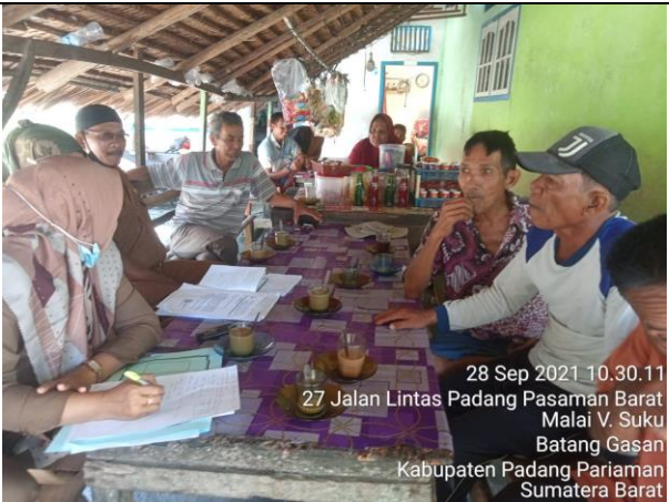
28 Sep 2021 10.30.11 27 Jalan Lintas Padang Pasaman Barat Malai V. Suku Batang Gasan Kabupaten Padang Pariaman Sumatera Barat