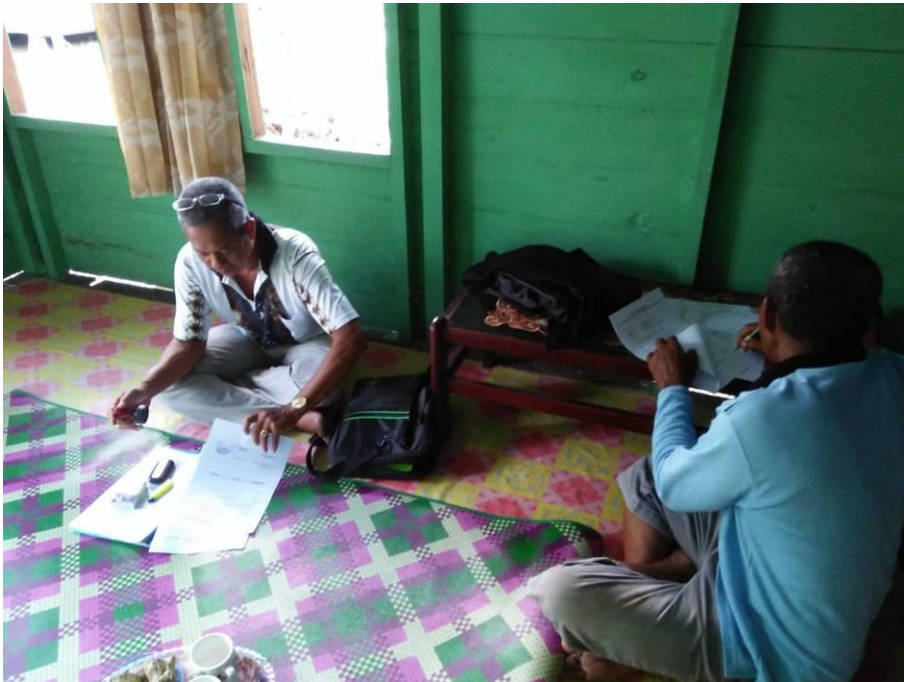
Kunjungan bulanan Penyuluh Perikanan