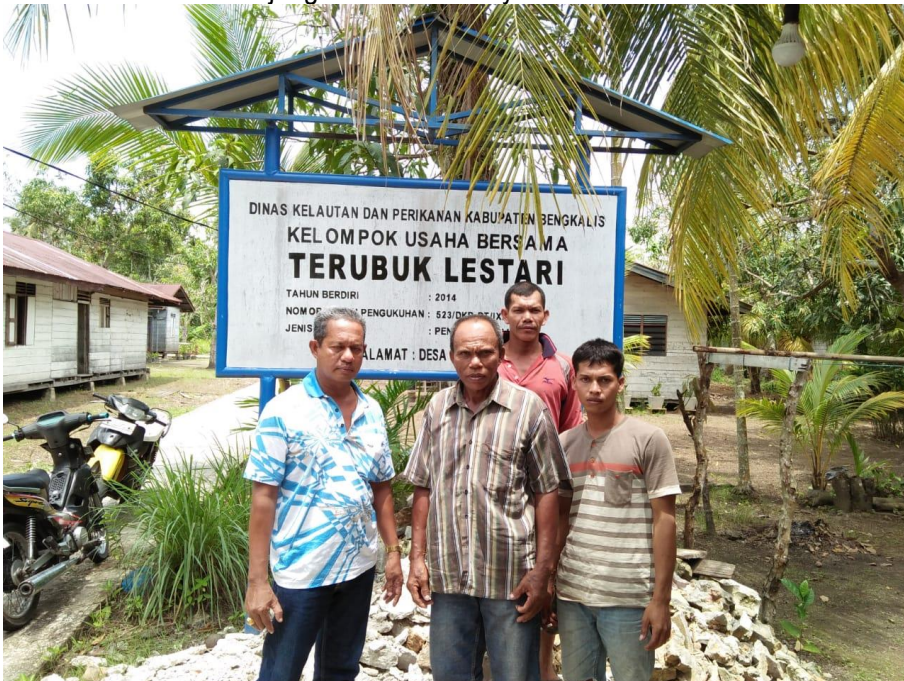
Foto bersama Penyuluh Perikanan di Plang KUB Terubuk Lestari