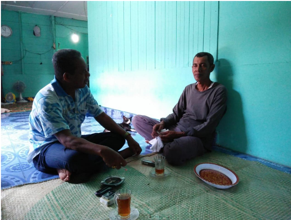
Kunjungan Peyuluh perikanan ke Sekretariat KUB Harapan Kita