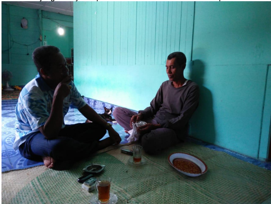
Kunjungan Peyuluh perikanan ke Sekretariat KUB Harapan Kita