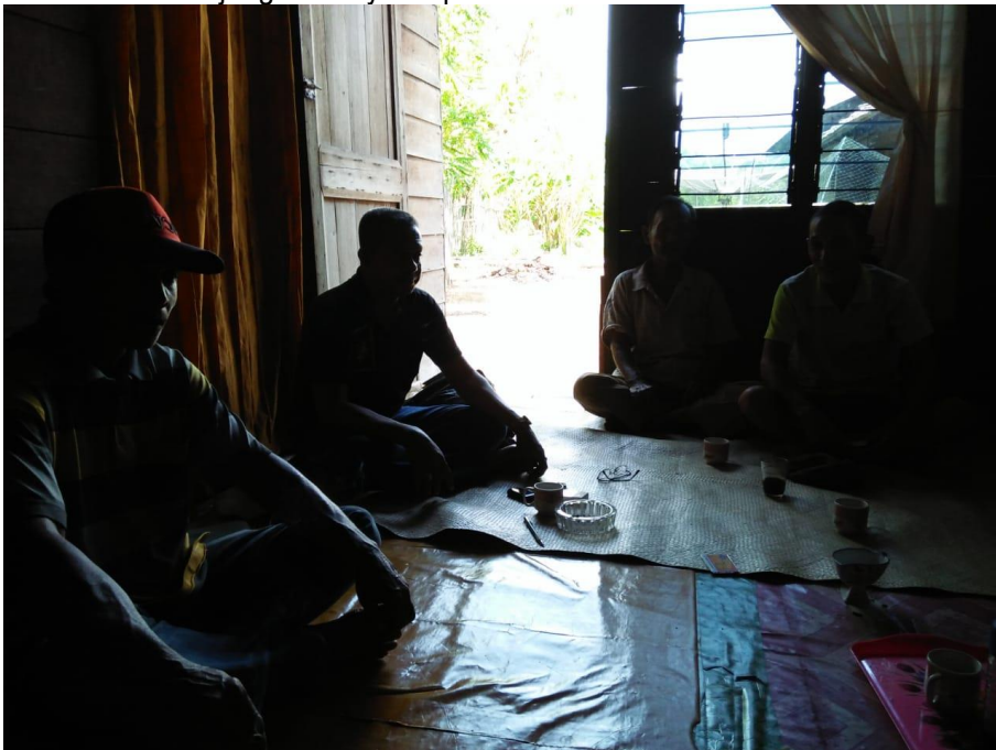
Pertemuan Bulanan KUB Bawal Putih