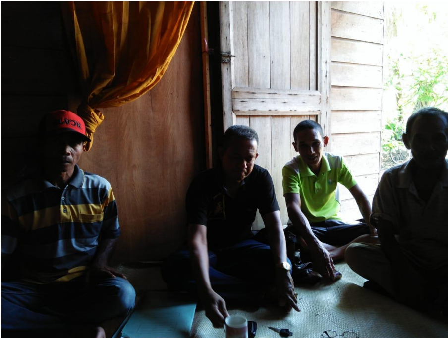
Kunjungan Penyuluh perikanan ke KUB Bawal Putih