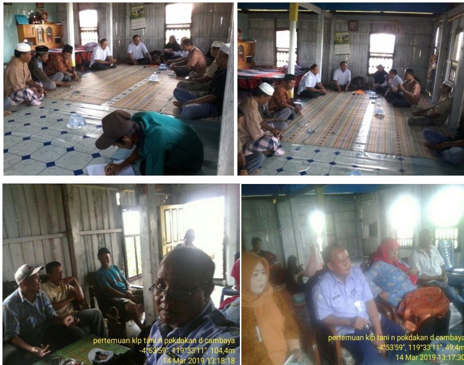
Pertemuan di Pokdakan Ujung Indah