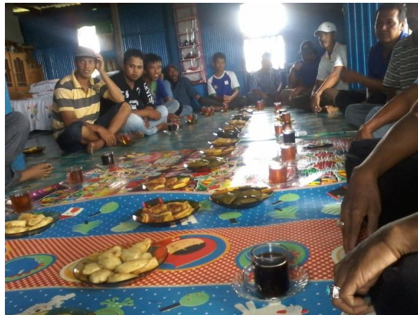
Pertemuan kelompok di Pokdakan Mutiara Indah