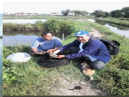
Kegiatan Budidaya Udang pada Pokdakan MUJUR