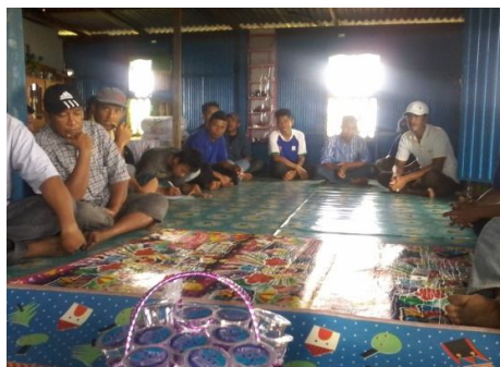
Penumbuhan Kelembagaan Pelaku Utama