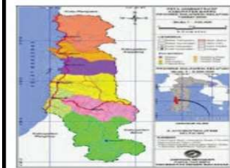
PETA KABUPATEN BARRU