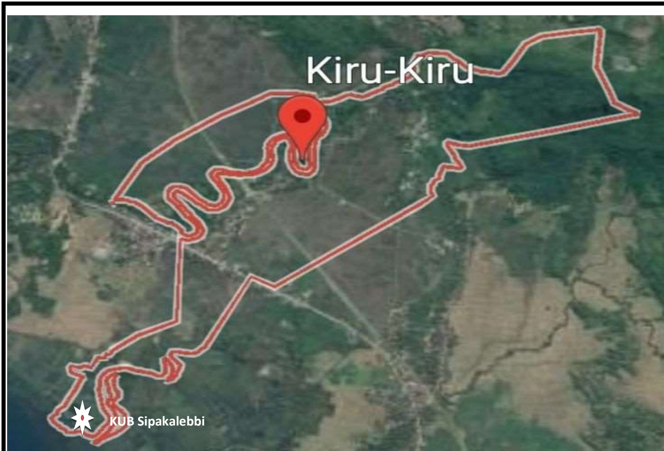
PETA KEC. SOP. RIAJA