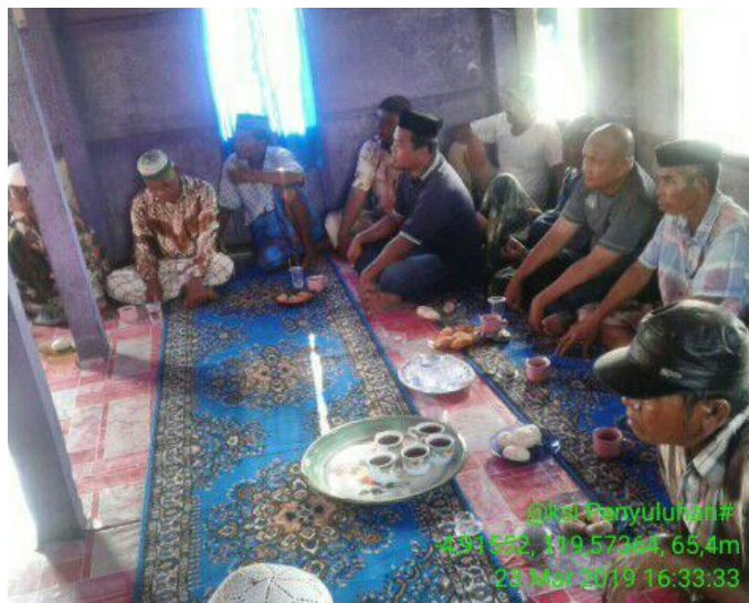
Pertemuan Kelompok penyusunan RUK Pokdakan Annur