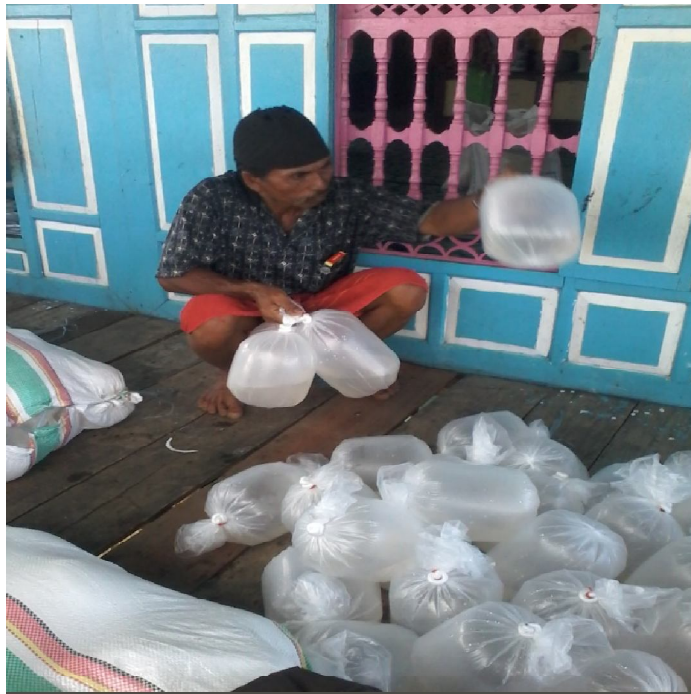
Angota Kelp Penerima Bantuan Pemerintah (benur)