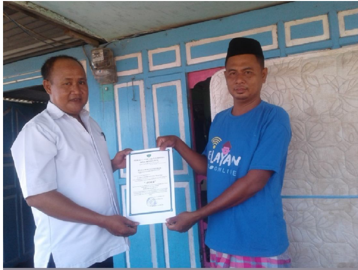
Penyerahan Piagam Pengukuhan Kelas Kelompok