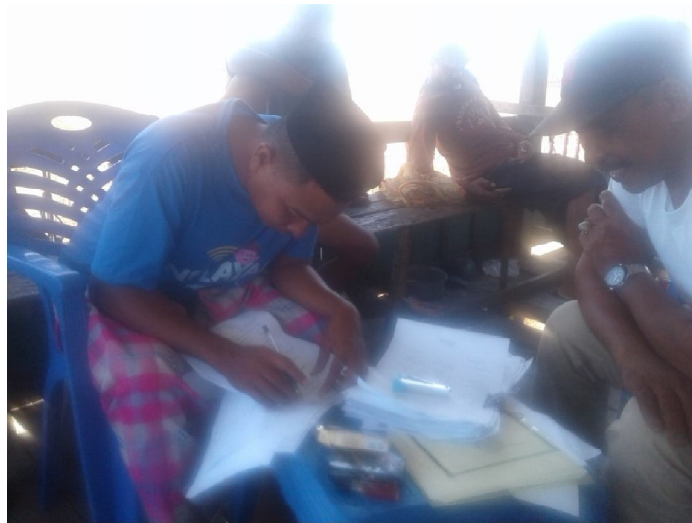
Pendataan anggota Kelompok penerima bantuan pemerintah