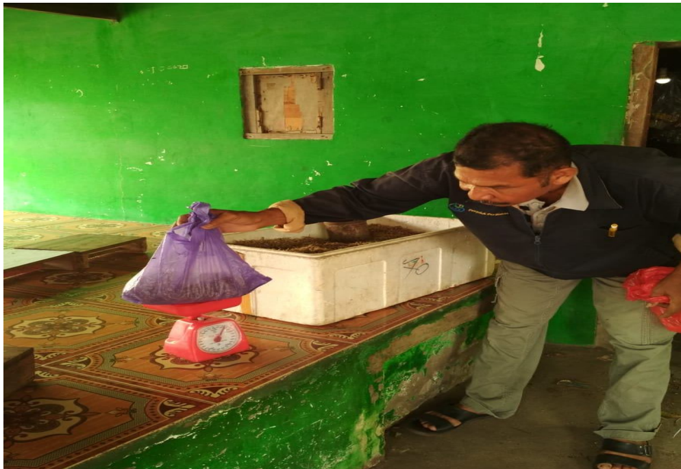
Penimbangan Produksi Hasil Tangkapan Ikan