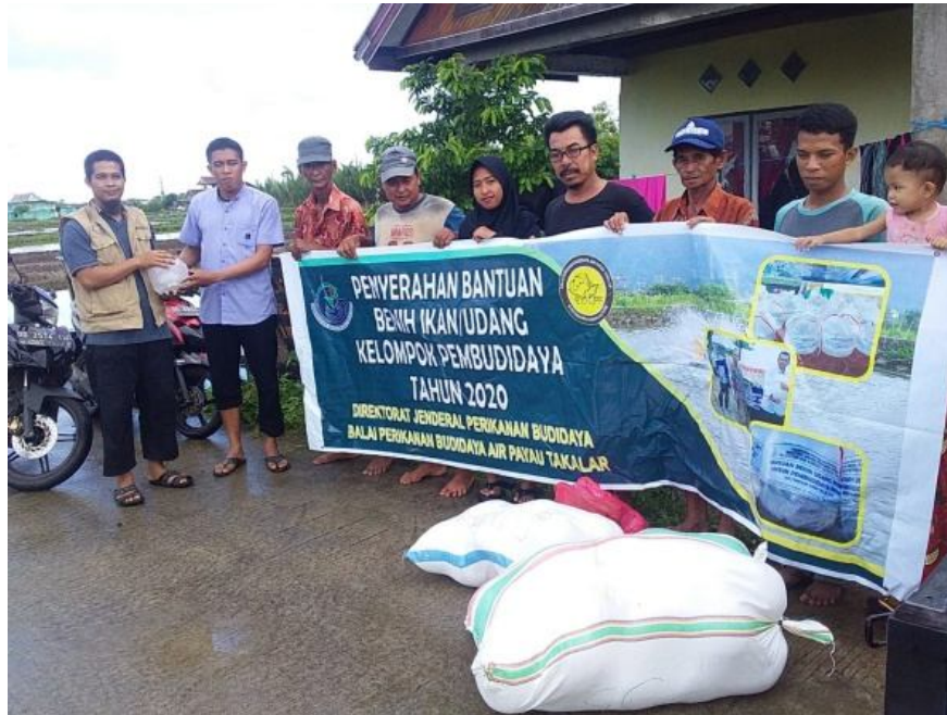
Bantuan Pemerintah Benur Udang Windu untuk Pkdakan