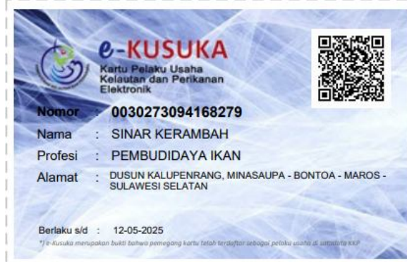
Kartu KUSUKA Korporasi Sinar Kerambah