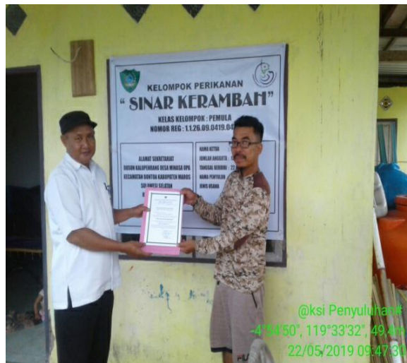
Penyerahan Piagam Pengukuhan Pokdakan