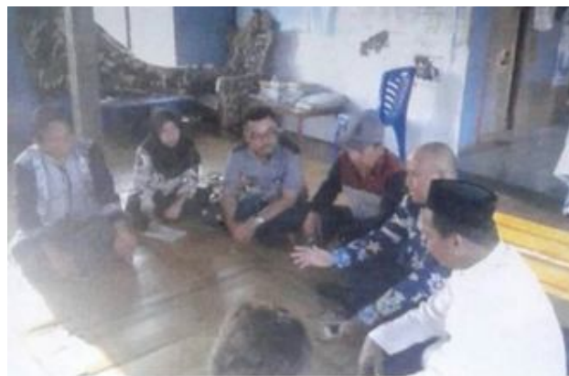
Pertemuan dengan pengurus kelompok