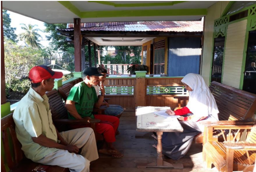
Pendataan Kartu Pelaku Usaha Kelautan Perikanan