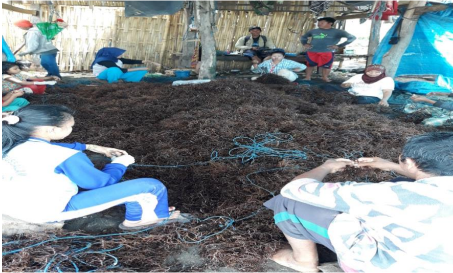
Pembibitan Rumput Laut