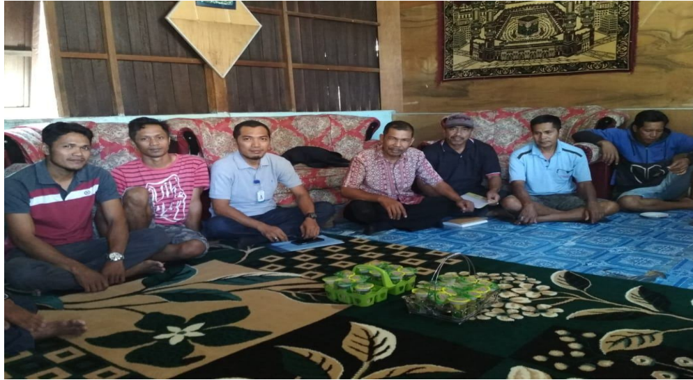
Sosialisasi Akses Modal Dari LPMUKP