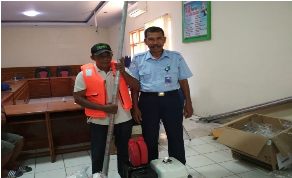
Penyerahan Bantuan Mesin Ketinting