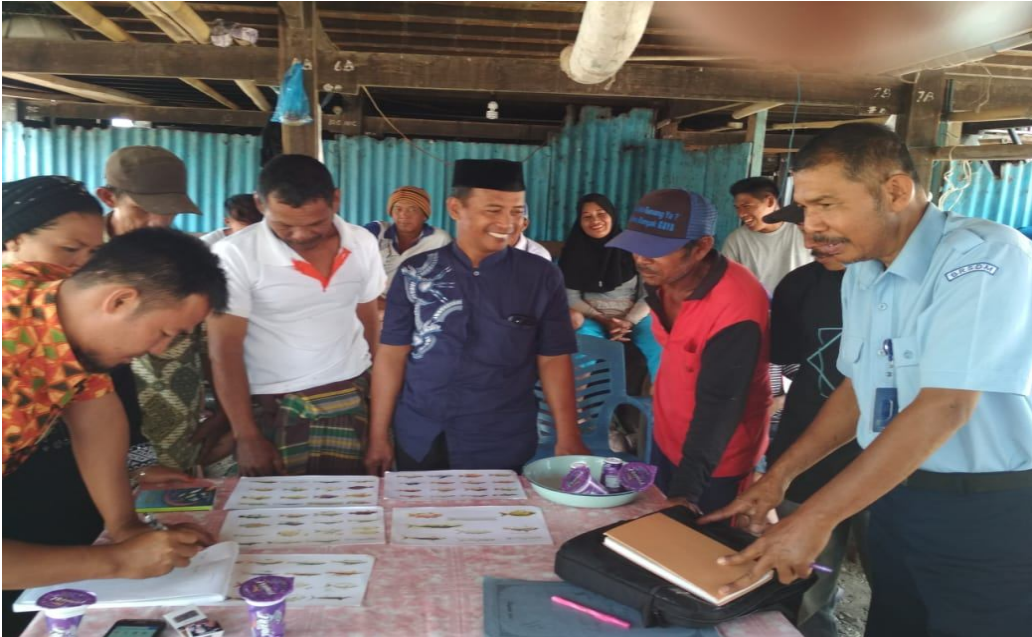
Pengenalan jenis jenis ikan