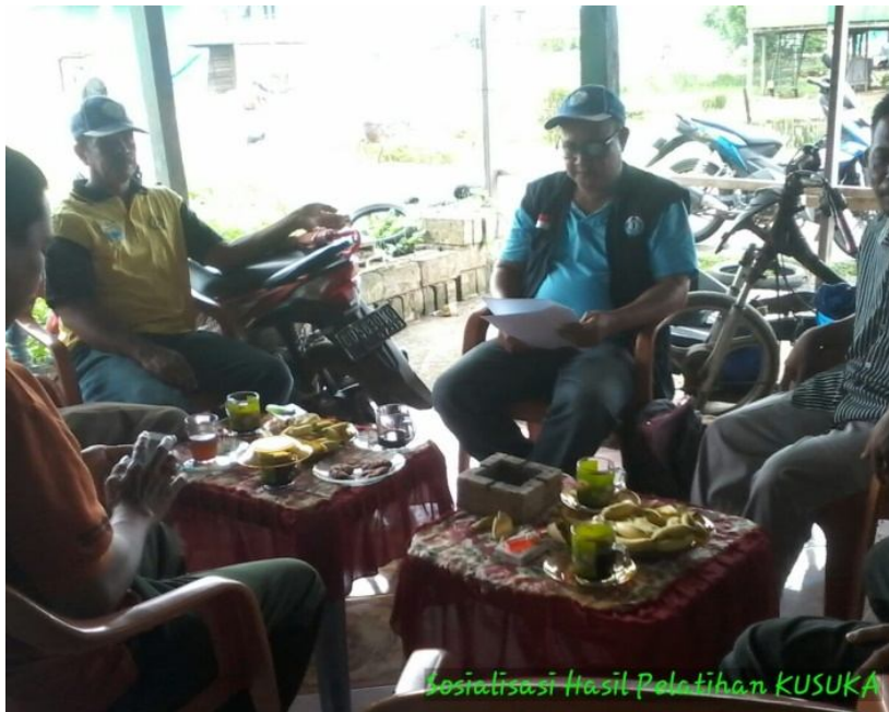
Sosialisasi "KUSUKA" di Tingkat Kelompok