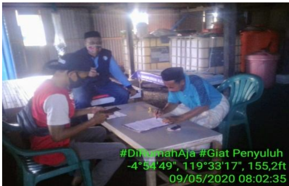
Penandatanganan BAST BP Vaneme Oleh Ketua Pokdakan