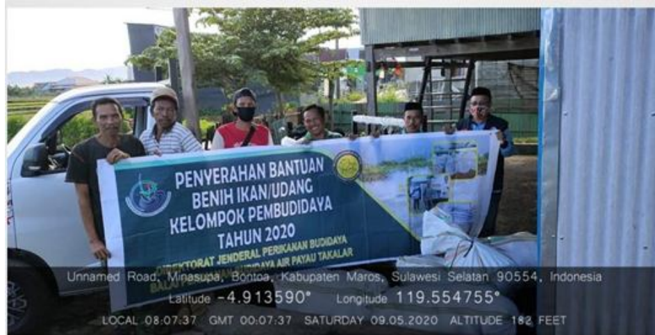
Bantuan Pemerintah Benur Vanname dari Takalar