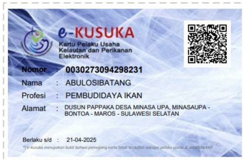
Kartu KUSUKA Korporasi Pokdakan Abulosibatang