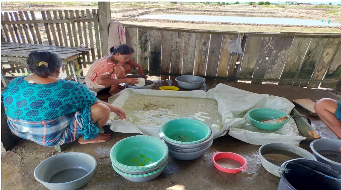
Penjualan Benur dan Nener