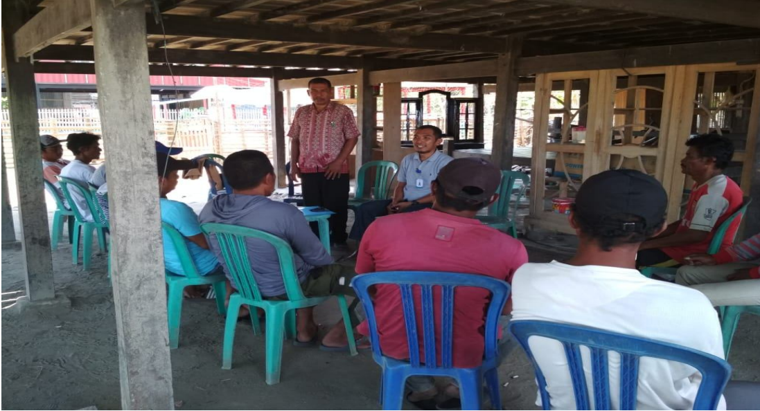
Sosialisasi Akses Modal Dari LPMUKP