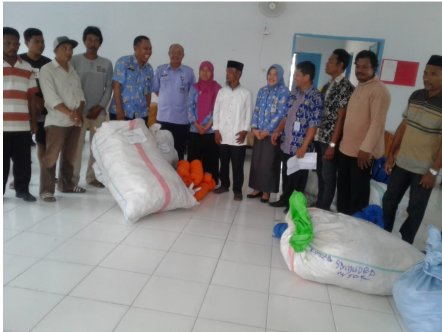
Penyerahan Paket Alat Penangkapan Ikan Ramah Lingkungan Oleh Dinas Perikanan Kab.Maros