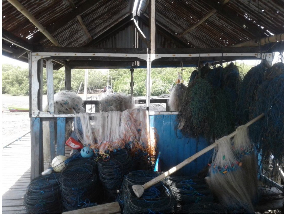
Jenis alat tangkap yang di gunakan KUB. Sungai Tekolabbua