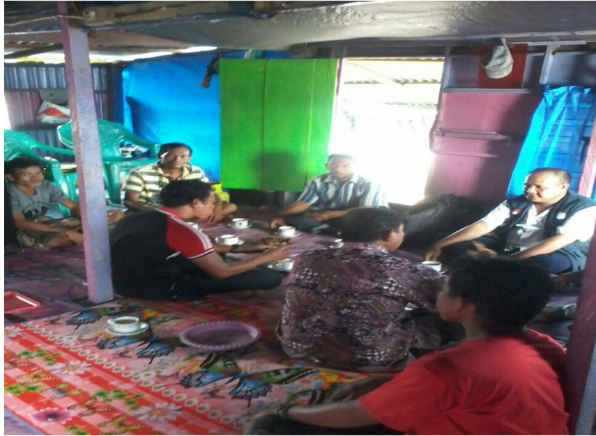
Pertemuan Kelompok di Sekretariat