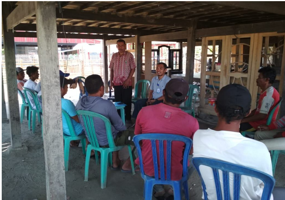
Sosialisasi Akses Modal Dari LPMUKP