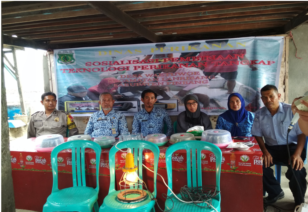
Akses Teknelogi Kenelayanan