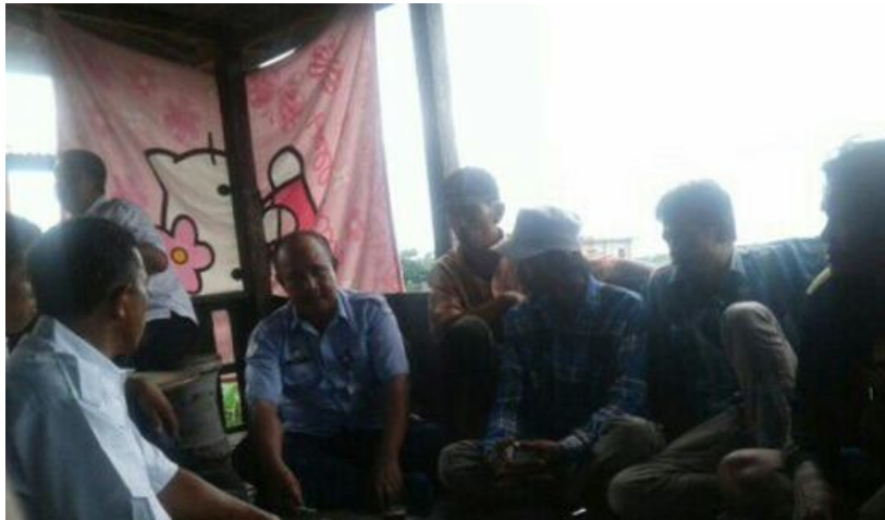
Pertemuan Kelompok dengan penyuluh