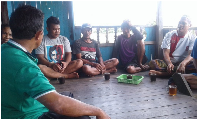
Pertemuan antar anggota Kelompok