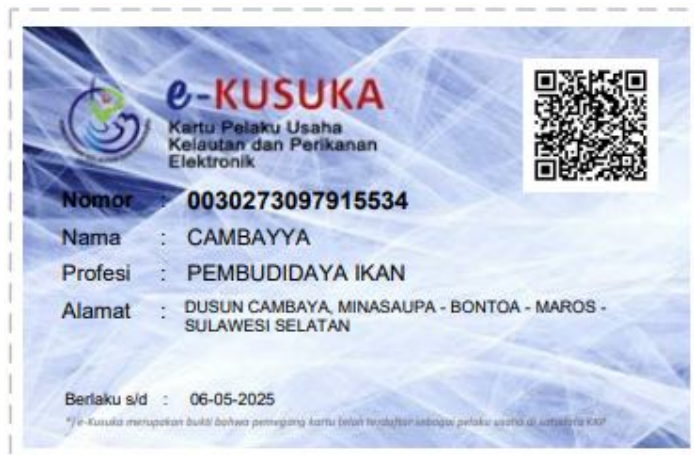
Kartu KUSUKA KORPORASI CAMBAYYA