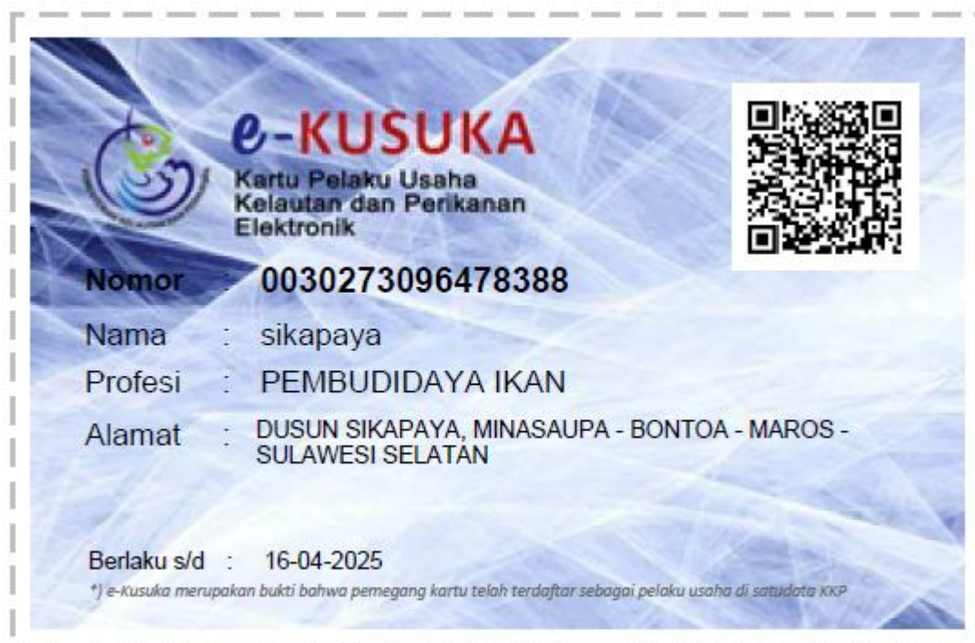
Kusuka Korporasi Pokdakan Sikapaya