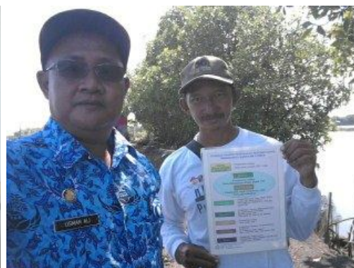
Monitoring Warna Air Tambak