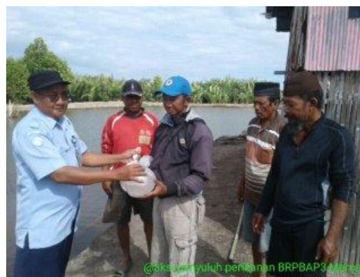
Penyerahan BP pada Kelompok