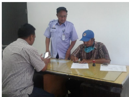
Penandatanganan BAST – BP